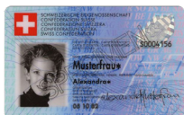
Carte d'identité Copie recto verso