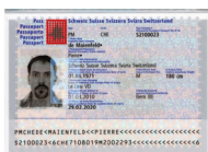
Passeport Copie de la page avec votre photo et votre signature