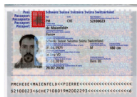
Passeport Copie de la page avec votre photo et votre signature