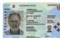
Autorisation de séjour Copie recto verso

Veillez envoyer la copie d'une pièce d'identité avec la demande à: Cornèr Banque SA Succursale BonusCard (Zurich) Case postale 8021 Zurich