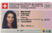
Permis de conduire Copie recto