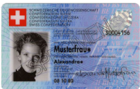
Carte d'identité Copie recto verso